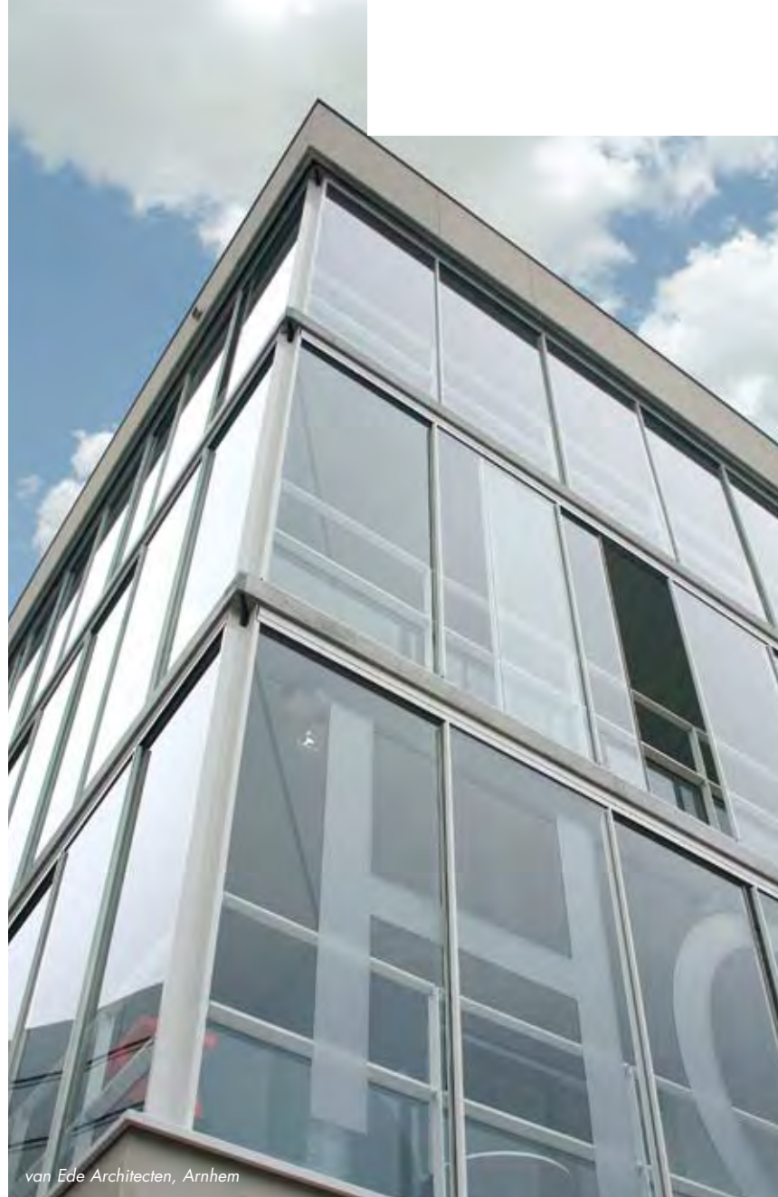
van Ede Architecten, Arnhem