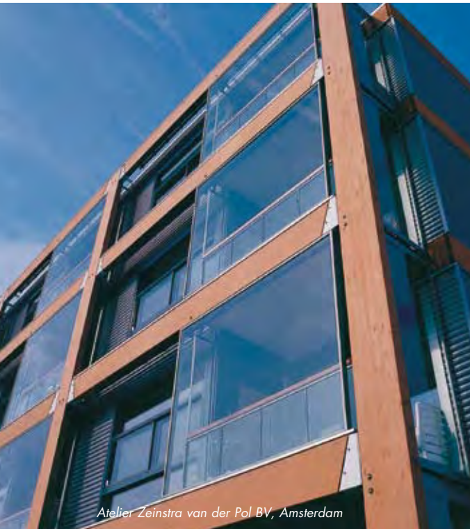
Atelier Zeinstra van der Pol BV, Amsterdam