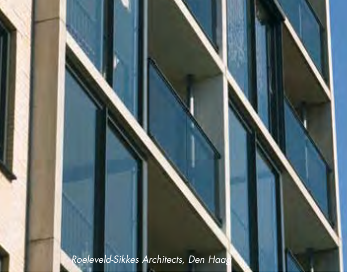
Roeleveld-Sikkens Architects, Den Haag