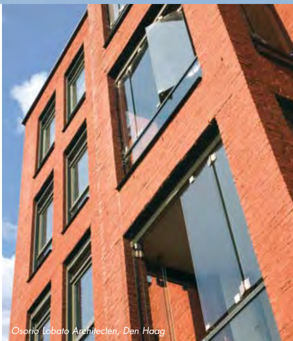
Osorio Lobato Architecten, Den Haag

Groot glasoppervlak met maximale lichtinval